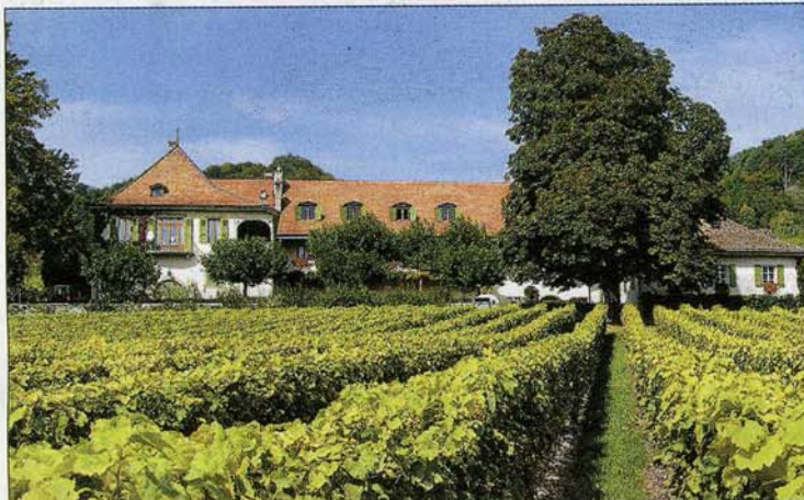
Le Château de Châtagnéaz à Mont-sur-Rolle, propriété de la maison Schenk SA, un des plus beaux fleurons de Clos, Domaines & Châteaux.

Responsable de la commission marketing de Clos, Domaines & Châteaux, Anouk Danthe confirme et