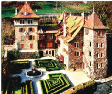
Le château de Chardonne. Son vignoble appartient à la maison Obrist, qui propose un unique cru, le chasselas Château de Chardonne.