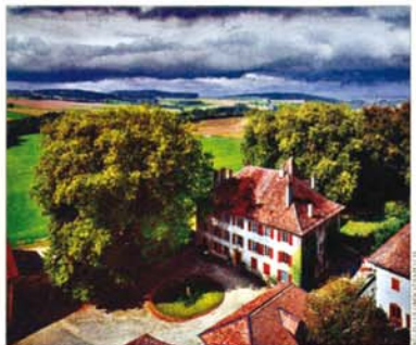
Château d'Éclépens. Une quarantaine de châteaux et d'anciens domaines munis d'un vignoble sont disséminés dans le Pays de Vaud. AGENCE

Château de Vuillens Le château n'est pas ouvert aux visites. Les vins peuvent être dégustés à l'Ermothèque de la Licorne, rue Louis-de-Savoie 75, 1110 Morges. Tél: 021/801 27 74 P. Br.