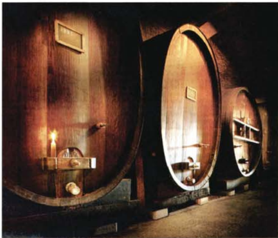
Dans la cave du Domaine de Chatelanat, dix-neuf propriétés et trois négociants de la région se sont regroupés au sein de l'association Clos, Domaines et Châteaux. Leurs vins sont considérés comme des appellations de cru. AGENCE

Pour distinguer les crus qui sont vendus sous sa bannière, l'association a adopté une charte de qualité, qui prévoit entre autres des volumes de production inférieurs aux normes AOC en vignoble dans le canton. « En raison de la situation géographique particulière, les Clos, Domaines et Châteaux sont considérés par la législation vaudoise comme des appellations de cru et, à ce titre, ne peuvent être assemblés à d'autres vins. Ce sont donc d'authentiques vins de ter-